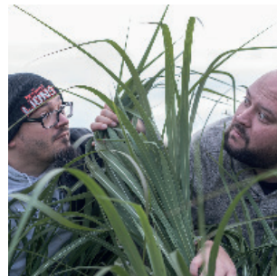
Groß & Artig